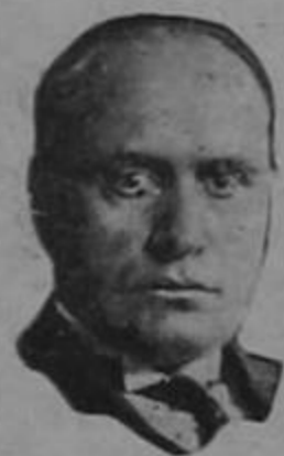
MUSSOLINI, El Hombre fuerte de Europa.